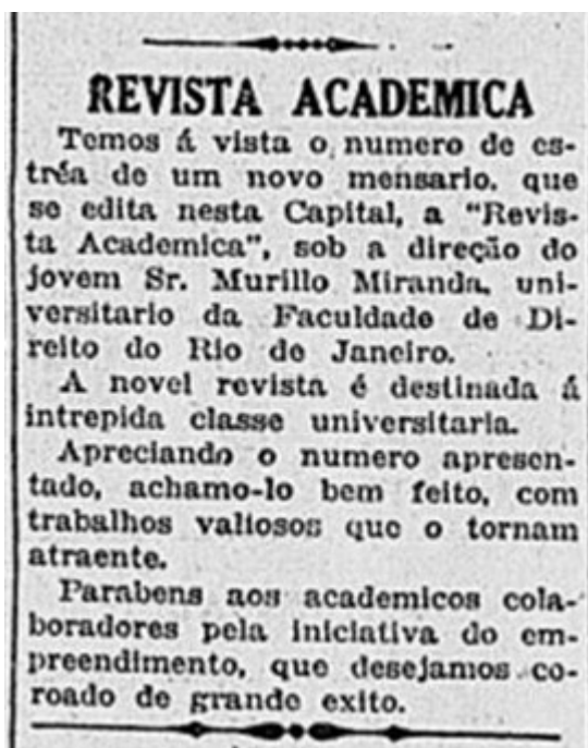
Figura 1 – Divulgação do nº 1 da Revista Acadêmica . Jornal do Brasil , 07 de setembro de 1933, p. 13.